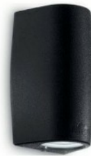
Iluminación LED Exterior LED lighting Exterior of property