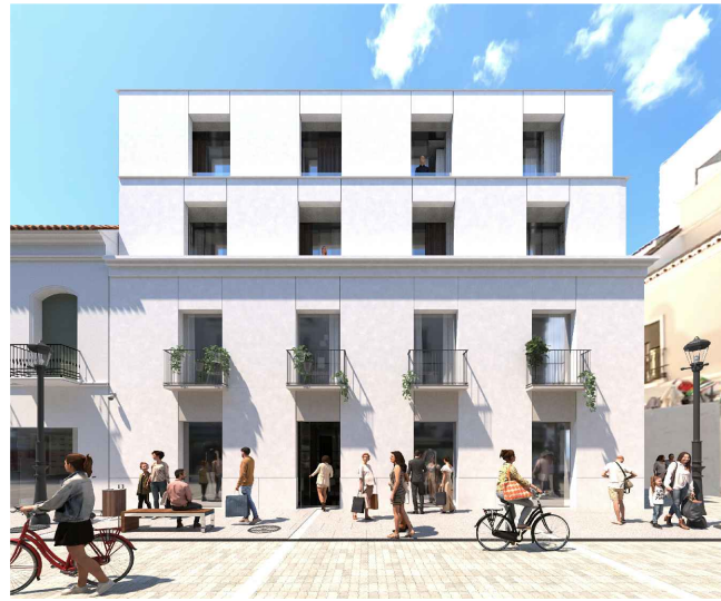
Infografía desde Calle Real