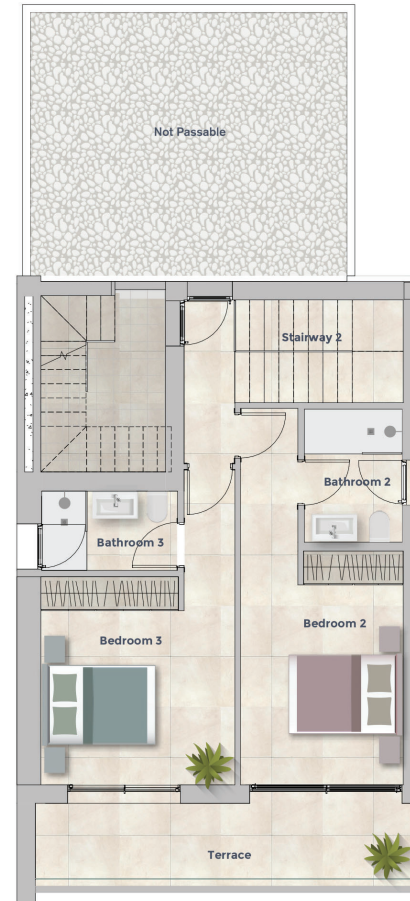
PLANTA PRIMERA FIRST FLOOR SUPERFICIE CONSTRUIDA BUILD SURFACE 57.28 M 2

SUPERFICIE ÚTIL TOTAL TOTAL USEFUL FLOOR SURFACE 67.83 M 2