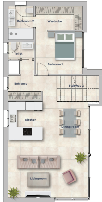
PLANTA BAJA GROUND FLOOR SUPERFICIE CONSTRUIDA BUILD SURFACE 83.71 M 2

SUPERFICIE ÚTIL TOTAL TOTAL USEFUL FLOOR SURFACE 70.05 M 2